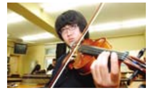
ストリングオーケストラ部