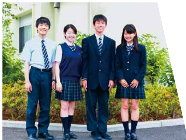
夏季はポロシャツも選択可能(令和2年度より)